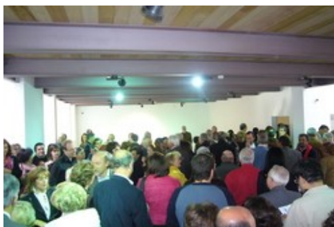
Durante a assinatura dos protocolos

Fizemos questão de vos mostrar o espaço do AA vazio. Primeiro porque achamos que ele é bonito nú, com a beleza duma criança acabada de nascer, ainda atónita com o espanto da vida extra uterina; depois, porque o queremos sentir cheio de amigos e das boas energias que nos trazem; por fim porque desejamos que queiram continuar a testemunhar todos os passos da sua vida.O AA vai pois começar pelo principio; este espaço vai ser ocupado progressivamente, com acontecimentos que se nos afigurem relevantes, ao mesmo tempo que irão sendo instaladas as colecções que fazem parte do acervo da Fundação. Sempre com a porta aberta, para que todos possam acompanhar as ciclópicas tarefas que nos separam da instalação da totalidade das peças que constituem as colecções.